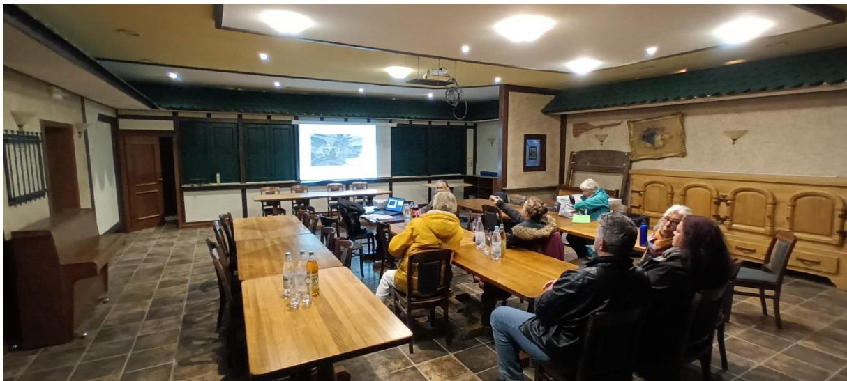
Teilnehmer:innen des 1. Workshops „Bauliche Aspekte“

Der Unterzeichner begrüßte die Teilnehmer:innen des Arbeitskreises und bedankte sich für das Interesse der Anwesenden, die Entwicklung von Forstmehren im Rahmen der Dorfmoderation aktiv mitzugestalten.